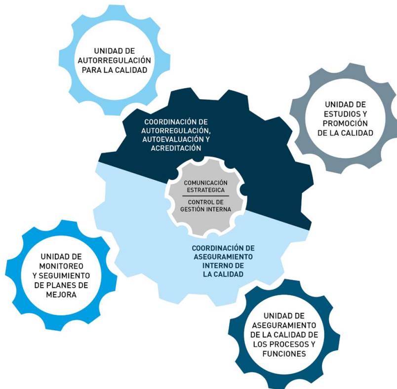
Organigrama matricial-funcional de la DIRGECAL